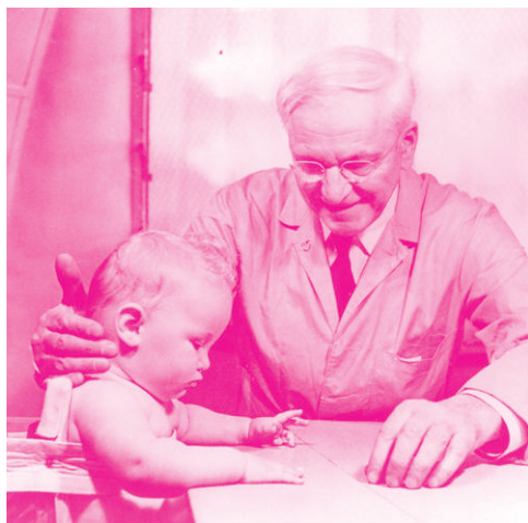
图 1-2 格塞尔

格塞尔(图 1-2)发现,在发展过程中,儿童表现出了极强的自我调节能力。当儿童突然向前进入一个新领域后,又会适度退却,以巩固取得的进步,然后再往前进。所以在儿童的成长过程中便形成了发展质量较高的年头与较低的年头有序交替的现象,格塞尔称其为“行为周期”。第一周期:2—5岁;第二周期:5—10岁;第三周期:10—16岁。每一周期内都有平衡与不平衡相互交替的同样程序。对教师 and 父母来说,当儿童处于发展质量较高的阶段时,应该更严格地要求他们;当儿童处于发展质量较低的阶段时,应该现实地看待他们,等待和帮助他们度过这一阶段,避免因粗暴和急躁而伤害他们。