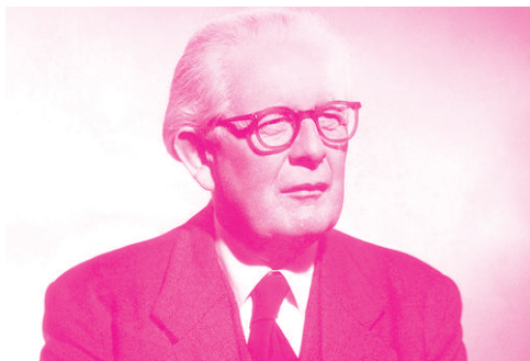
图 1-3 皮亚杰